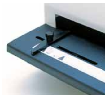
Einfaches Ausrichten vor dem Stanzen