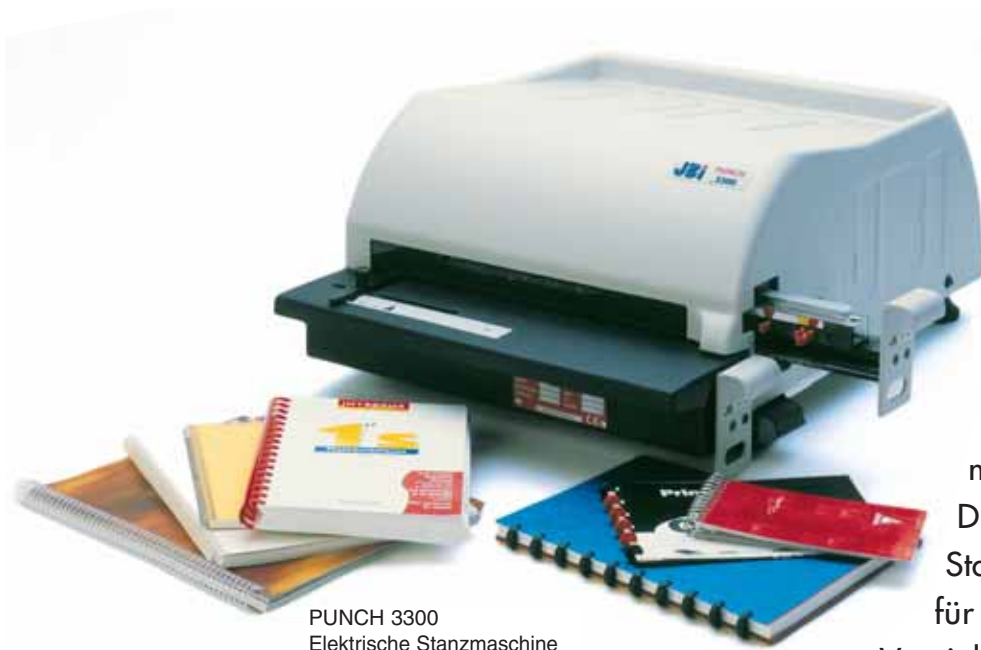
PUNCH 3300 Elektrische Stanzmaschine

Der PUNCH 3300 ist ein leistungsfähiger Dokument-Stanzer, den Lhermite® entwickelt hat, um auf effiziente Weise eine breite Palette professionell gebundener Bücher mit einer Bindebreite von max. 330mm stanzen zu können. Diese mittelgroße Dokument-Stanze-Lösung eignet sich perfekt für Firmenbüros, zentrale Vervielfältigungsabteilungen und Digitaldrucker/On-demand-Drucker.