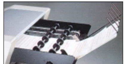
Schuppenablage M 3010