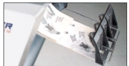
Gitterablage M 3000