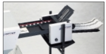
M 3000 mit Online-Falzer