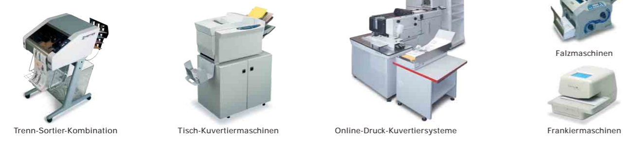
Trenn-Sortier-Kombination Tisch-Kuvertiermaschinen Online-Druck-Kuvertiersysteme Falzmaschinen Frankiermaschinen

Wir sind in Ihrer Nähe Weitere Informationen über Einsatzmöglichkeiten, Preise und Finanzierungsformen geben Ihnen jederzeit gerne unsere Vertriebsmitarbeiter.