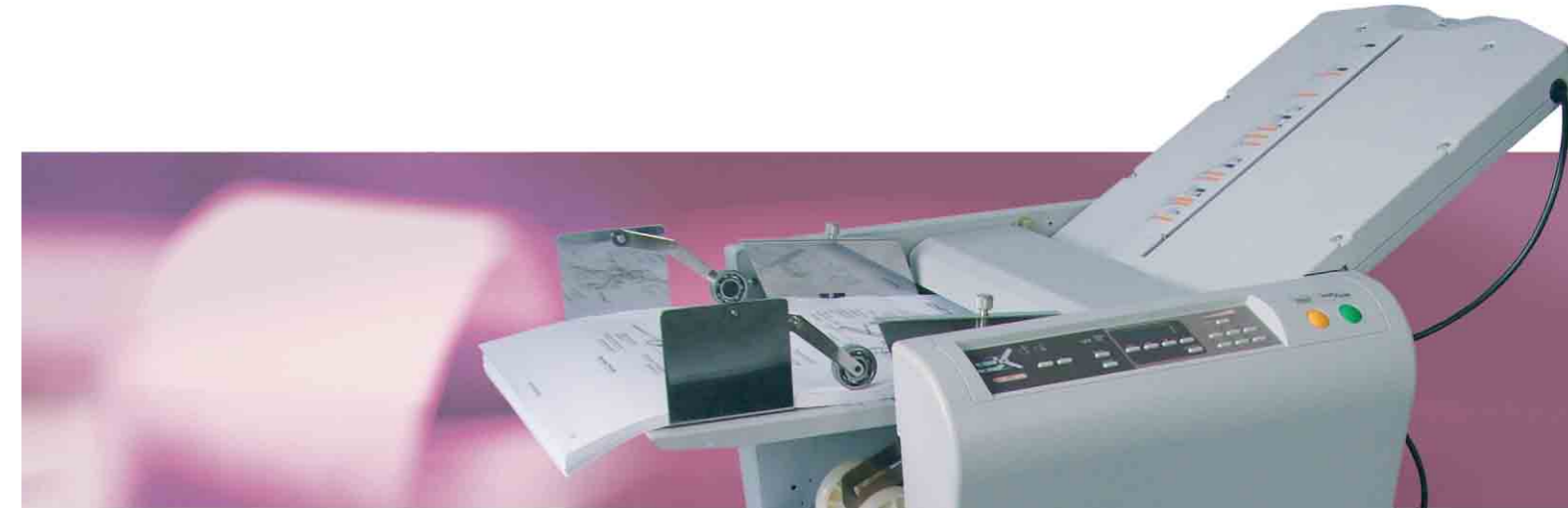
Die geniale Hilfe für Büro und Poststelle bei Formularen bis DIN A3