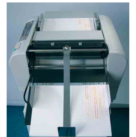
TF MASTER-A – Option Perforationseinheit z.B. für die Vorperforierung von Überweisungsträgern