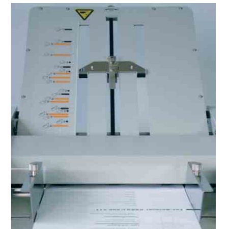
TF MASTER-M – Falztaschenschnelleinstellung mit selbsterklärender Skala und Feinjustage