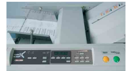
TF MASTER-A – zusätzliche Tasten für die automatische Falzartenauswahl und für die Abspeicherung von Sonderformaten