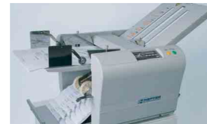
TF MASTER-M mit manueller Falzartenwahl

Überzeugen Sie sich selbst von den vielen Vorteilen. Wir stellen Ihnen die TF MASTER-Serie auch gerne persönlich vor.