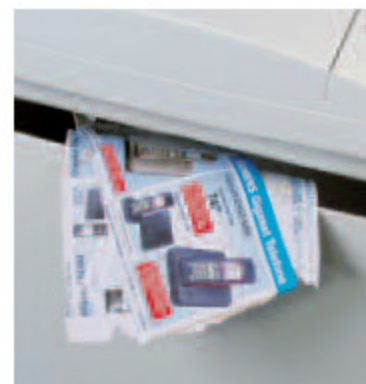
Durch Frontschlitz auch für anderen Papierabfall nutzbar