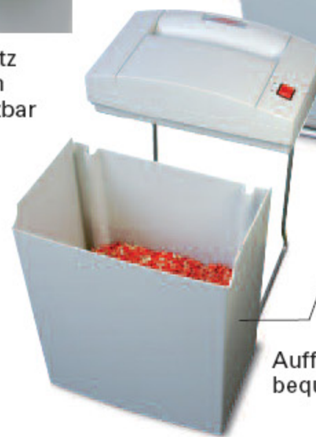
Auffangbehälter bequem zu entleeren