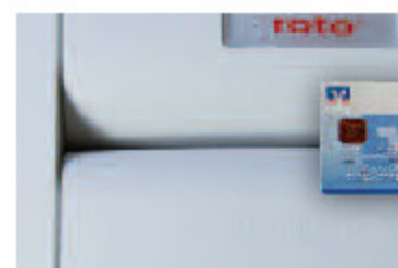
Zusätzliche Medien: Kreditkarten