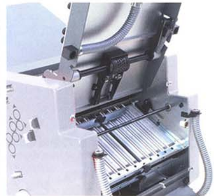
Gute Zugänglichkeit zu den unteren Falztaschen.

Die computerunterstützten Modelle der „Foldmaster“-Serie verfügen über einen Komfort, der seinesgleichen sucht und bieten neben der Umrüstung per Knopfdruck auch eine Speichermöglichkeit für wiederkehrende Jobs. „Mit Foldmaster ist