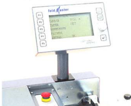
Das Steuergerät beinhaltet alle Komponenten zum Zählen, Takten und Steuern.

F lexibilität kann entscheidend sein! Für Karl Ammerer ist das eine wichtige Komponente im modernen Finishing. Denn: „Wer nicht jeden Tag die gleichen Verarbeitungswege beschreitet, muss täglich auf individuelle Anforderungen der Kunden bestens eingehen.“ Tatsächlich sind im Bereich Paper Finishing Begriffe wie „Just-In-Time“ und „On-Demand“ längst im Sprachgebrauch verankert. Schnelle Aktionen und Reaktionen sind Forderungen des Marktes.